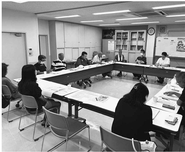
拡大推進委員会の様子

とき 10月31日(木) 19:00~ ところ さかなや道場 荒川区町屋1丁目3-3 ハセベ町屋第5ビル1F