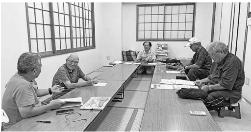
町屋南分会の様子

1月1日現勢1847人に対し1805人で折り返し、秋の結びづくりdaysの目標は65人に対して26人の到達となっております。まだ、目標を達成している分会はありませんが町屋北分会は目標6人に対し5人の達成と王手をかけています。また、日暮里1分会や事業所分会はレクリエーションを企画し、活動参加者を増やす取り組みに力を注いでいます。残された行動日もわずかとなります。支部目標の達成に向け、全分会で最後まで奮闘し、打上式を迎えましょう。