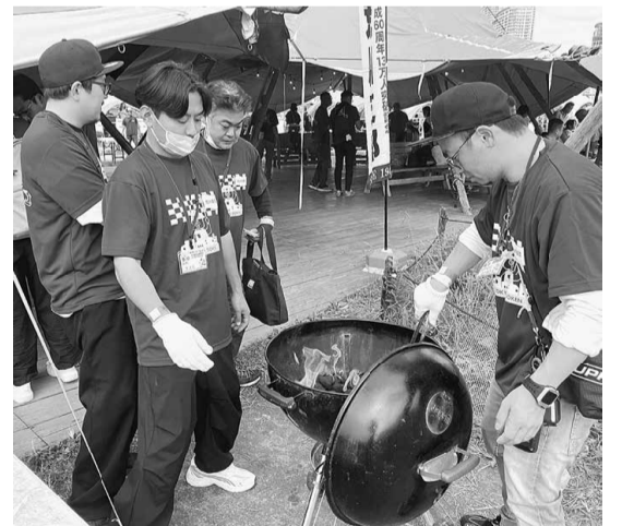
中々火が着かずひやひやしました

最初は火が着かないなどちよっとしたトラブルもありバタバタしましたが、いつの間にかワイワイ楽しんでいる声が会場内に響き渡っていました。