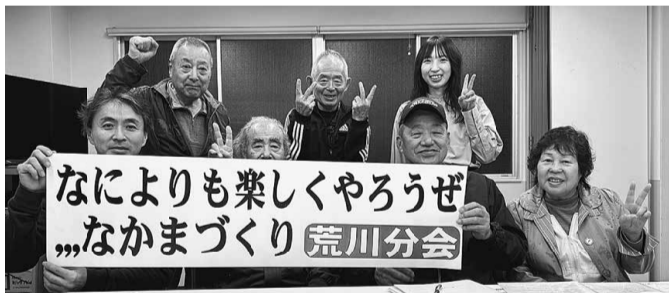
最後まで粘りを見せた荒川分會