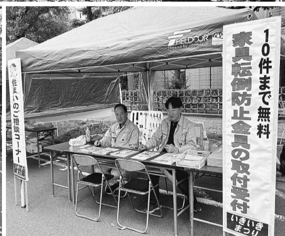
住宅相談は去年の倍以上の件数