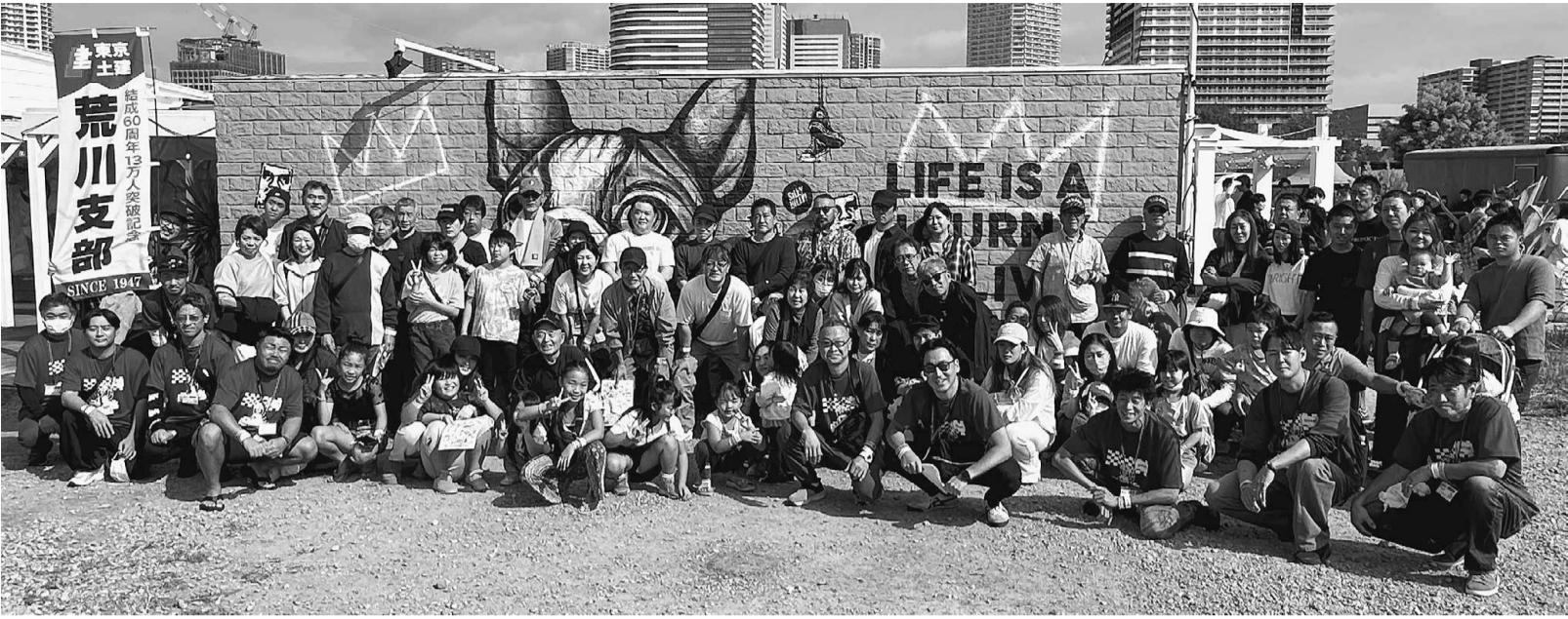
大人から子供まで多くの仲間が参加しました