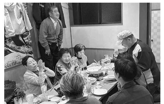
分會の垣根を超えて仲良くお祝い

連続で拡大目標を達成、同年の春秋達成は8年ぶりです。長い2ヶ月間、そして今までに経験したことのない大変な「秋の結びづくりdays」の行動でした。心が折れそうになりました。 振り返って見ると10日16日時点では28人と半数にも届かない状況でした。 しかし！終盤戦の奮闘は本当に目覚ましいもので、