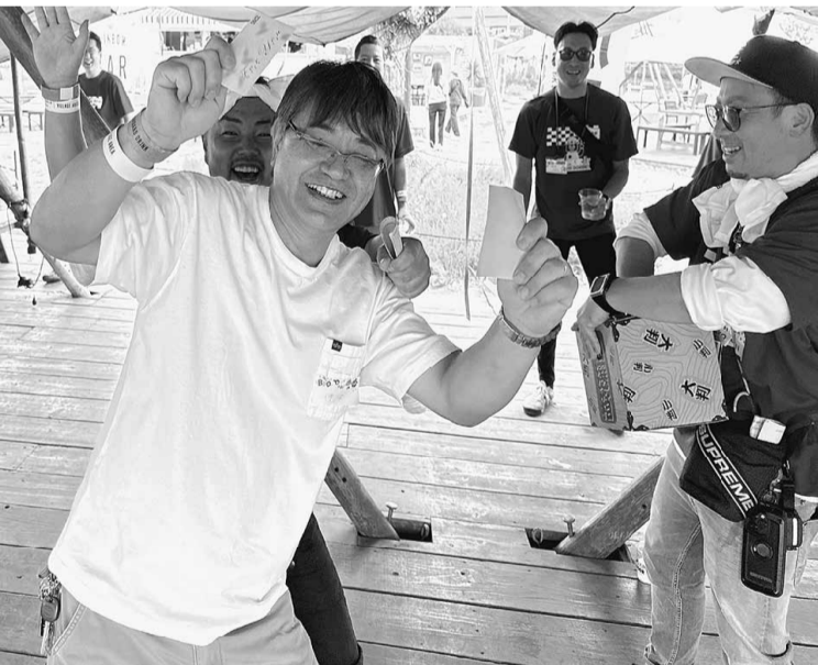
抽選会では皆さんの笑顔で溢れていました

最後にはアンケート用紙を記入して頂いて、14時30分に終了しました。今回は食べ物も美味しく、参加者も身近な場所にテーブルがあったので交流もしやすく、全体的に大成功だったと思います。参加できなかった人にも今回以上に楽しんで参加してもらおう為にも、今回の結果を踏まえ参考にして取り組んでいきます。 参加していただいた皆さん、本当にありがとうございました。心から感謝しています。次回のレクも楽しみにしていて下さい。次回開催時ぜひ参加のほどよろしく願います。そして後継者対策部の皆さん、準備や片付けなど朝早くから大変お疲れ様でした。ありがとうございます。