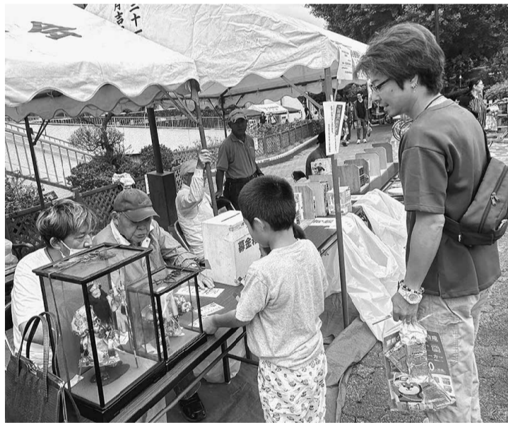
親子でスタンプラリーを楽しみます

食企画は人気で、途中で買い出しに行く程でした。 また、起震車体験や防災課の展示、震災時の被害写真等の展示で震災・防災への注意喚起をし、ただ楽しいだけではなく子供たちの学びの場ともなりました。 区民まつりは多くの来場者で賑わい、建設従事者の存在意義を周知できる場となったことに組合員の奮闘に感謝します。 反省点として各ブースの要員の数が足りなくなる場面が各企画で見られ交代で休憩がでなくなるなどの課題も残りま 支部からは組合員(書記局・来賓除く)・家族あわせて120人(2023年132人)が参加しました。福祉募金は、総額14万5千円(前11万5千円)が寄せられ、春の住宅デーのキャンパと合わせて社会福祉協議会へ届ける予定です。