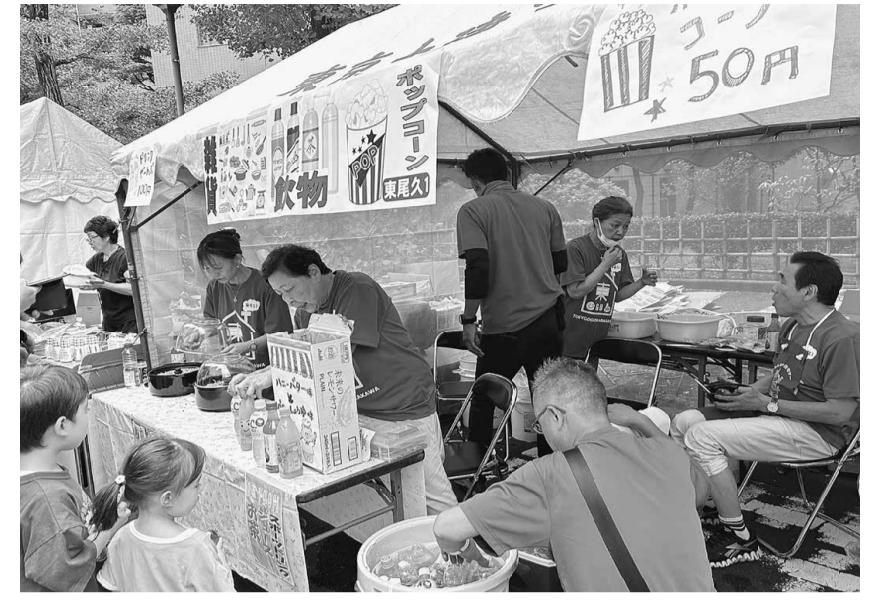
様々な種類のポップコーンが人気でした