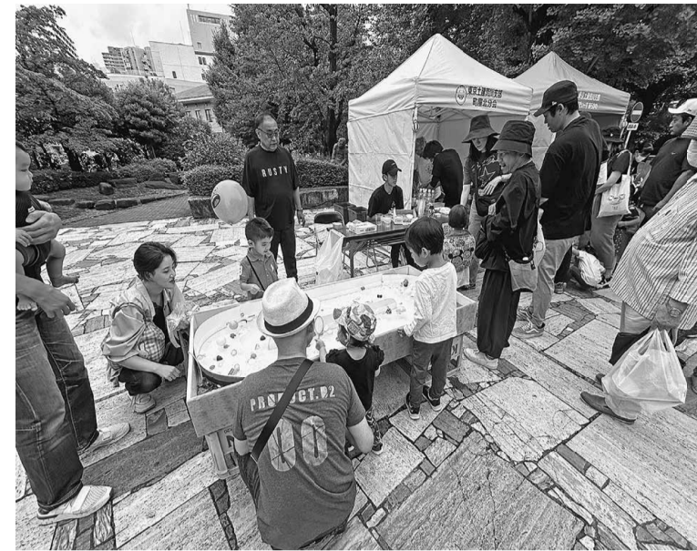
おもちゃすくいや光るドリンクが子供に人気