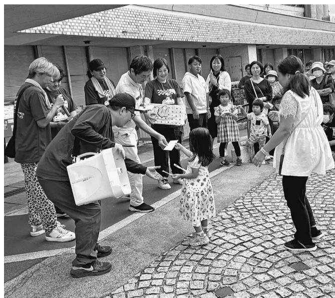
マイクパフォーマンスで盛り上がった抽選会