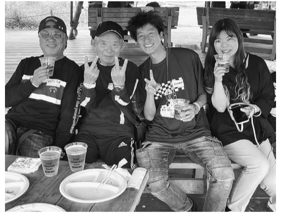
分会の垣根を超えて交流しました

落ち着いた頃には自然な会話から交流が始まり、中には名刺交換をされる方も何人かいらっしゃって、交流の中で仕事の繋がりづくりもできていた様子でした。その後もお互いが知り合い同士を紹介し合って繋がりが出来ていました。中盤には抽選会を行い、後継者対策部員が中心となって抽選し、皆さんすごく盛り上がっていました。当たった方はおめでとうございます。はずれてしまった方はぜひ次回も参加してリベンジして