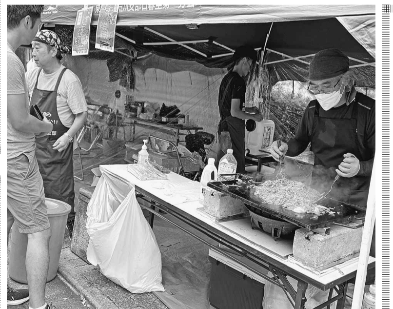
美味しい香りにお客さんが殺到