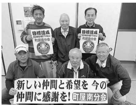
早期達成を果たした町屋南分會

最後の最後まで諦めずに月間成功のため連日連夜の奮闘を繰り広げた多くの組合員、家族、書記局の皆さんには心より敬意を表し、御礼申し上げます。本当にお疲れさまでした。