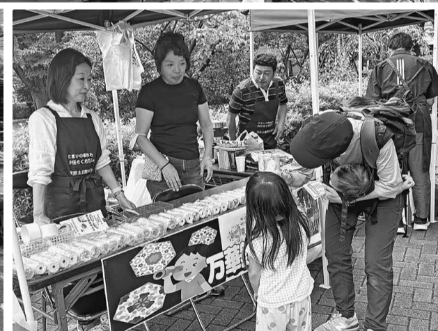
万華鏡づくり興味津々の親子