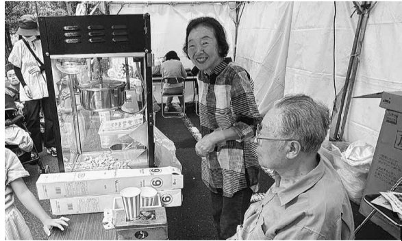
好評でポップコーン完売しました